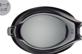
ブラック 可視光線透過率：45%