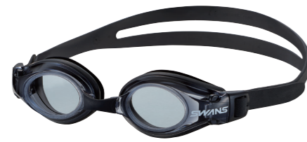
〈スモークレンズ〉ブラック