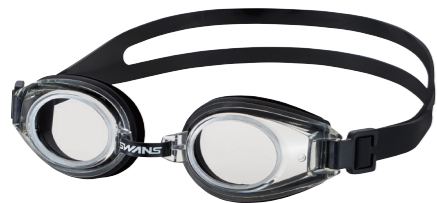
〈クリアレンズ〉ブラック