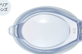
クリアホワイト 可視光線透過率：89%