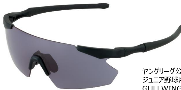
ヤングリーグ公認 ジュニア野球用モデル GULLWING FLEX-S

山本光学では、「紫外線から眼を護るための環境づくり」「快適に着用できる製品づくり」の両面から少年野球選手のサングラス普及に取り組んでまいりました。最近では、長時間日差しの強い球場など屋外での眼の紫外線対策や、特に硬式野球の場合、ボールが眼に直撃したり砂やほこりの対策など安全面からも、その必要性が重視されています。